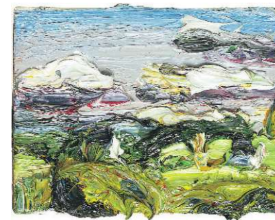
Starkes Bild: Düsseldorf, Foto: Achim Müller; VG Bild-Kunst / Galerie Hans Mayer. Schön rund: Düsseldorf, Foto: Achim Müller; VG Bild-Kunst / Galerie Hans Mayer. Immer ein Lächeln auf den Lippen: Michael Werner; VG Bild-Kunst/CONRADS Düsseldorf. Wo Zerstörung ästhetisch wird: Jason Gringler; VG Bild-Kunst/CONRADS Düsseldorf.